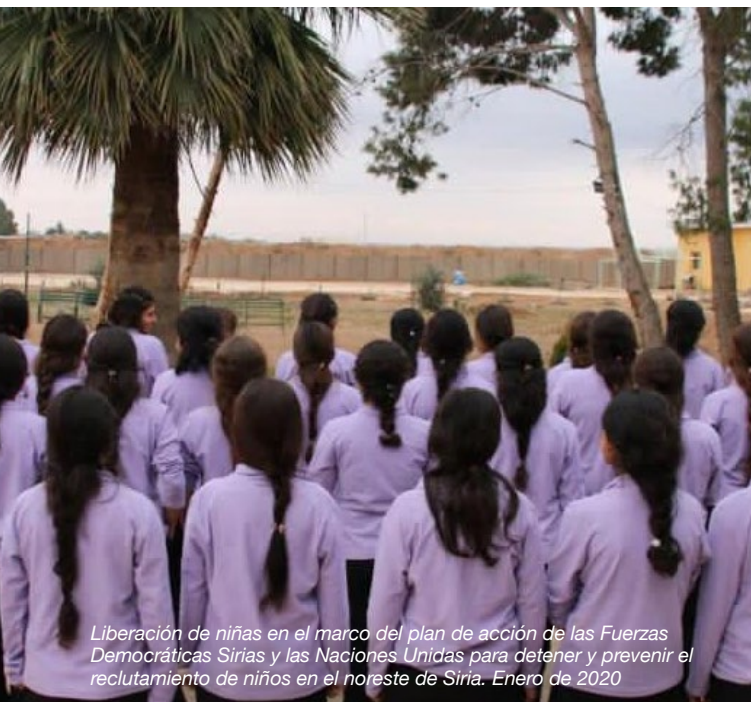
Liberación de niñas en el marco del plan de acción de las Fuerzas Democráticas Sirias y las Naciones Unidas para detener y prevenir el reclutamiento de niños en el noreste de Siria. Enero de 2020

El enfoque centrado en la seguridad o los aspectos militares de los programas tradicionales de DDR ha representado un obstáculo enorme para la liberación de las niñas, 139 en el que el número de niñas liberadas a través de los procesos formales por lo general es muy bajo. Durante décadas, los programas formales de DDR excluyeron a las niñas y niños que no participaban activamente en las hostilidades. En Sierra Leona y Timor Oriental, las mujeres y las niñas sin armas no pudieron acceder a los programas de DDR, dado que inicialmente se implementó el enfoque una persona, un arma. Este enfoque luego se modificó a un abordaje colectivo sobre la base de una lista de ex combatientes que proporcionaron los comandantes. A pesar de este cambio, una vez más, las mujeres y niñas rara vez integraban las listas, ya que principalmente cumplían funciones de apoyo y los comandantes no las consideraban asociadas al grupo. 140 En diversos contextos, los actores sobre el terreno no intentaron identificar a las niñas por medio de un proceso de desmovilización formal, ya que no habían recibido información de que las niñas estaban asociadas. En función de los datos disponibles, las niñas representan entre el 6 y el 50 % 141 de los niños asociados a las fuerzas y los grupos armados, aunque solo una mínima parte de estas son liberadas e identificadas formalmente.