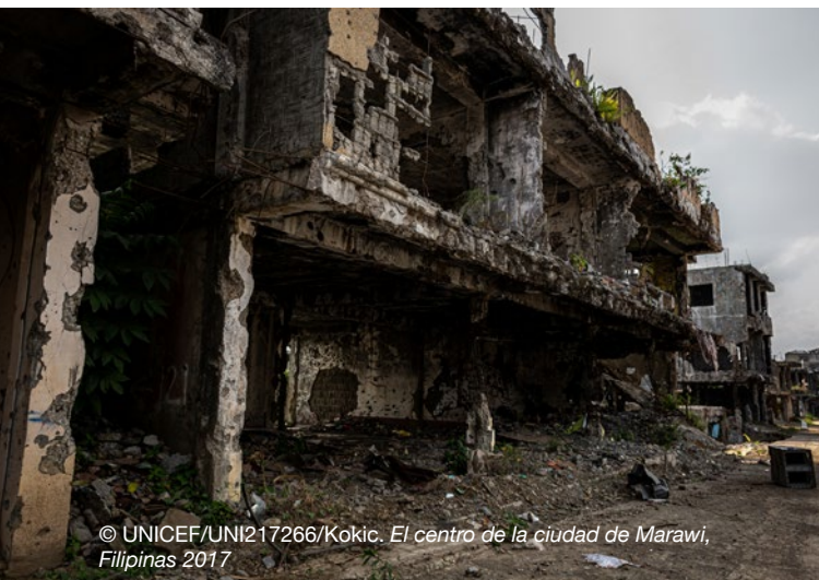
El centro de la ciudad de Marawi, Filipinas 2017

Esta Nota Técnica aporta información sobre los desafíos que enfrentan las niñas asociadas a las fuerzas y los grupos armados (GAAFAG, por las siglas en inglés) durante su reclutamiento, el período de asociación y su reintegración, al igual que las lecciones aprendidas y las prácticas alentadoras para implementar programas de prevención, liberación y reintegración con perspectiva e información de género. Existen escasas pautas disponibles a nivel global que respalden a los profesionales sobre el terreno en términos del diseño y la implementación de programas destinados a las GAAFAG. El objetivo de esta Nota técnica es contribuir a la comprensión de las necesidades específicas de las GAAFAG y las implicancias para el desarrollo de programas. Esta Nota técnica recibe información de una revisión de datos secundarios que incluye la literatura gris y las investigaciones académicas, el análisis de información recopilada del estudio de 37 grupos armados y fuerzas armadas 2 y de las entrevistas con los informantes clave. Los informantes clave incluyeron a investigadores y representantes del gobierno, organismos de las Naciones Unidas y ONG nacionales e internacionales de 14 países 3 en los que se reclutaban niños en 2019.