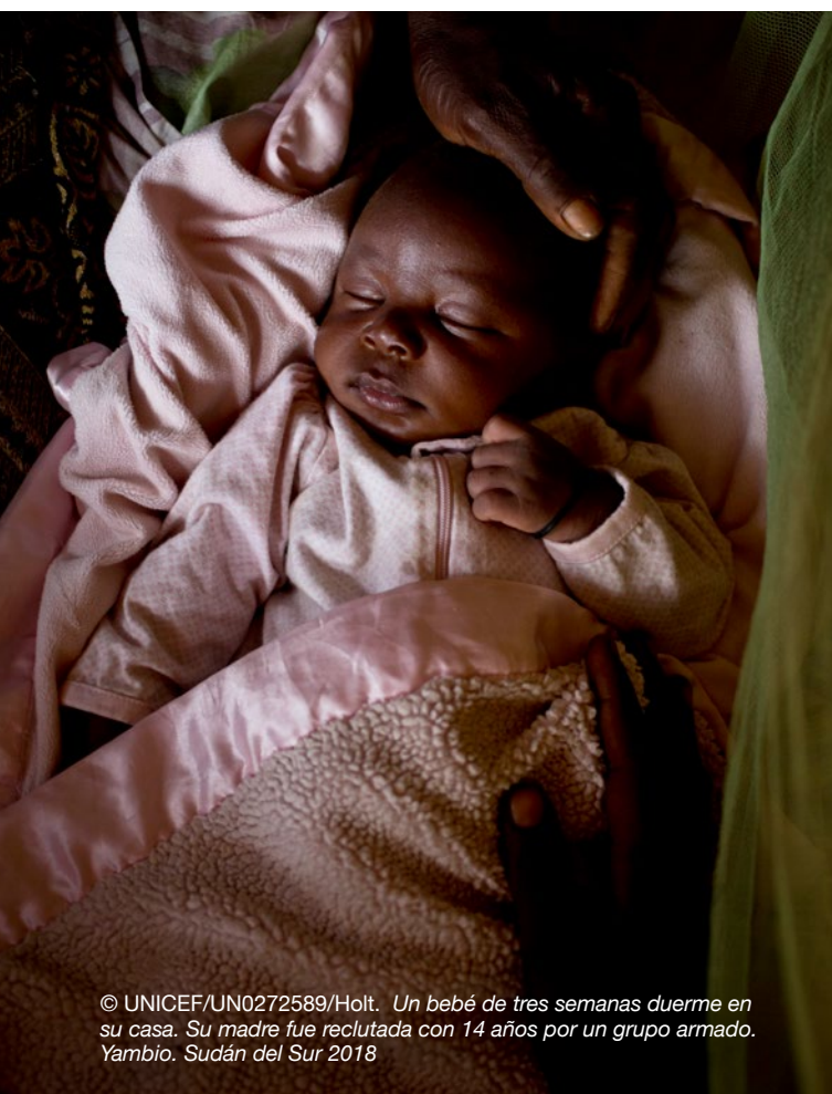
Un bebé de tres semanas duerme en su casa. Su madre fue reclutada con 14 años por un grupo armado. Yambio. Sudán del Sur 2018