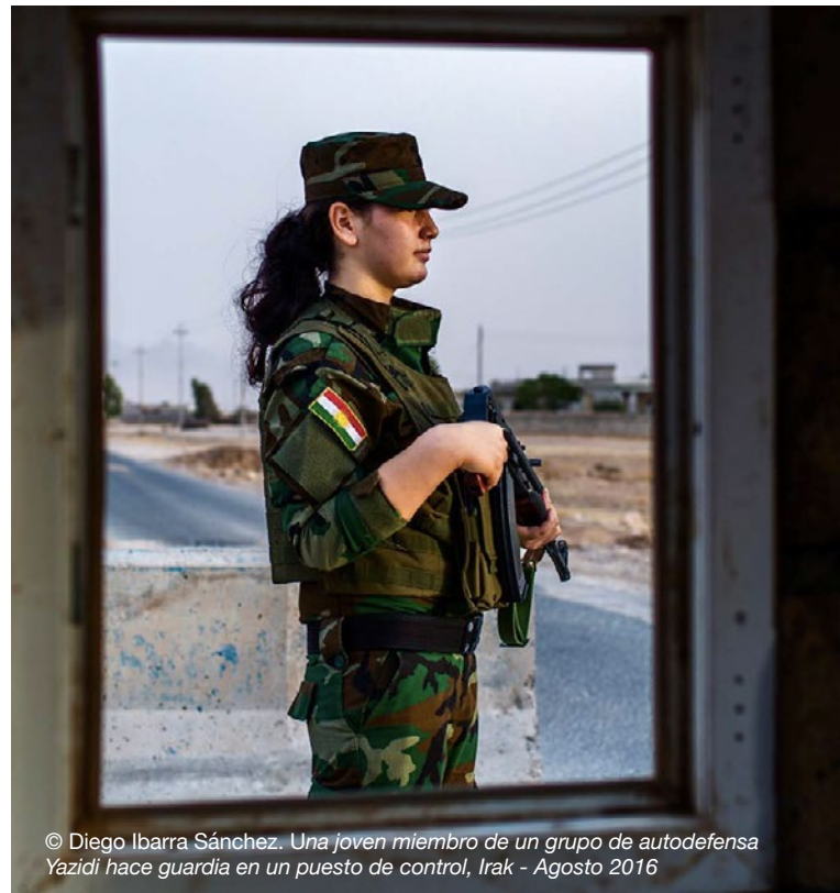
© Diego Ibarra Sánchez. Una joven miembro de un grupo de autodefensa Yazidi hace guardia en un puesto de control, Irak - Agosto 2016

Mantener el control de las niñas y adolescentes en sus filas suele ser una prioridad para las fuerzas y los grupos armados, en particular cuando se secuestran niñas. Las formas de control pueden ser similares a las que se utilizan para los varones. Sin embargo, algunos mecanismos de control se aplican específicamente a las niñas. Por ejemplo, es posible que las niñas tengan menos libertad de movimiento, ya que asumen roles de género tradicionales y padecen una mayor sensación de explotación y sometimiento. En algunos contextos, los grupos armados tatuaron, marcaron o tallaron la piel de las mujeres para vincularlas de manera permanente al grupo. 57