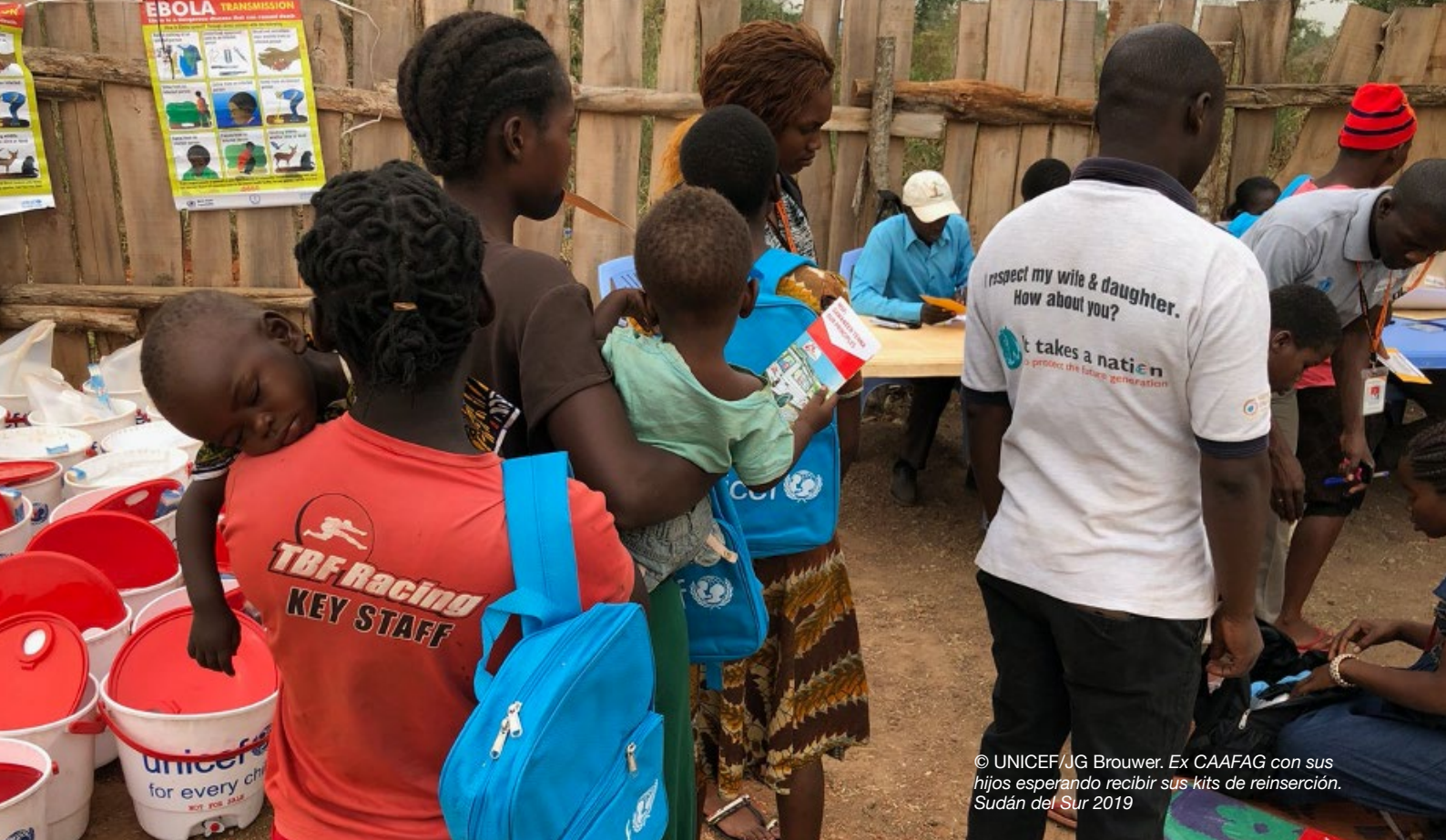
© UNICEF/JG Brouwer. Ex CAAFAG con sus hijos esperando recibir sus kits de inserción. Sudán del Sur 2019