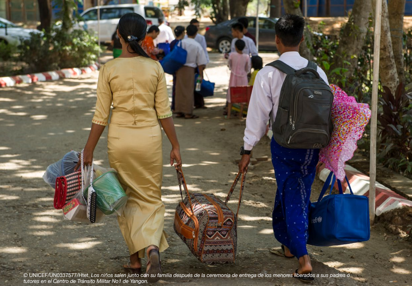
Los niños salen junto con su familia después de la ceremonia de entrega de los menores liberados a sus padres o tutores en el Centro de Tránsito Militar No1 de Yangon.