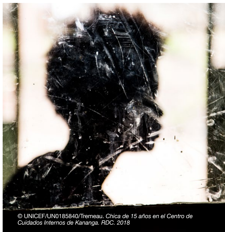
Chica de 15 años en el Centro de Cuidados Internos de Kananga. RDC. 2018

las niñas se han reunido con su familia, o si la liberación ha sido informal. Hay escasas historias exitosas de asistencia médica después de la reintegración en la República Democrática del Congo, gracias a la coordinación de actores médicos que brindaron ayuda a niñas, niños y adolescentes con enfermedades de transmisión sexual. 201