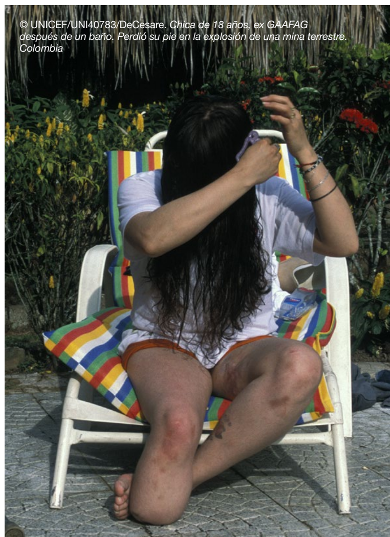
Chica de 18 años, ex GAAFAG después de un baño. Perdió su pié en la explosión de una mina terrestre. Colombia

Es esencial realizar un mapeo de los servicios existentes y la derivación a los servicios especializados sobre la base de una evaluación médica integral. 278 Esta incluye cirugía, fisioterapia, psicoterapia, tratamiento médico y equipos médicos, como muletas, sillas de ruedas, anteojos, audífonos o prótesis. Sin embargo, las lecciones aprendidas destacan la importancia de incluir tanto a las GAAFAG con discapacidades como resultado de la guerra, como a otros niños con discapacidades de las comunidades afectadas por el conflicto, en cualquier proyecto. Se puede proporcionar apoyo adicional, cuando esté disponible, como acceso a una escuela para niños sordos o ciegos, o servicios y beneficios especializados que brindan los Ministerios de Asuntos Sociales, Educación, Salud o Trabajo.