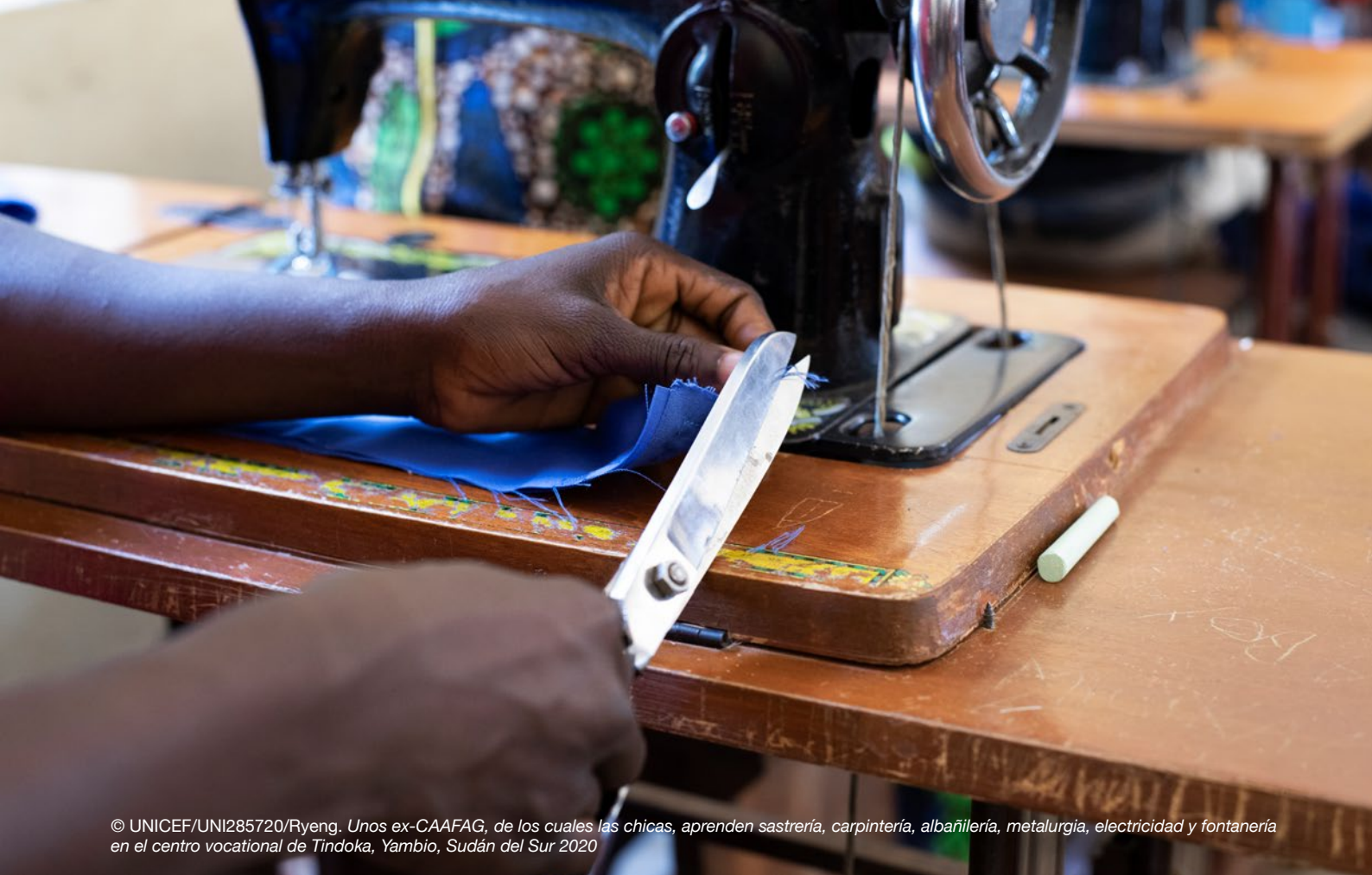
Unos ex-CAAFAG, de los cuales las chicas, aprenden sastrería, carpintería, albañilería, metalurgia, electricidad y fontanería en el centro vocacional de Tindoka, Yambio, Sudán del Sur 2020

habilidades comerciales, suelen ser costosos, demasiado breves y podrían ser más eficientes. Estos programas casi nunca dan cuenta de la capacidad del mercado de absorber nueva mano de obra, los deseos y los intereses de las adolescentes, su capacidad y habilidades existentes y los recursos locales o familiares existentes que puedan tener a su alcance. Asimismo, los niños (y, en particular, las niñas) no suelen incluirse en el diseño de tales programas.