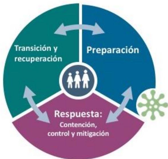
Gráfico 1. Ciclo descriptivo de las etapas de la COVID-19 en las comunidades para los niños de todas las edades y las etapas del desarrollo.

Por otro lado, conforme se suprimen las medidas de contención y se restablecen la movilidad y las interacciones en las comunidades, van surgiendo nuevas dificultades. A medida que los niños y las familias pasan de la etapa de respuesta a la recuperación, las medidas de protección de la niñez y adolescencia también se van transformando. La COVID-19 es una enfermedad dinámica e incierta: no se mantendrá necesariamente en la etapa de recuperación, sino que, en muchas comunidades, obligará a los niños, las familias y los agentes de la protección de la niñez y adolescencia a regresar a la etapa de la respuesta y, después, a pasar de nuevo a la de recuperación. Este tipo de movimiento de atrás hacia adelante presenta nuevas limitaciones a las personas y las comunidades y requiere agilidad, adaptación y vivir con lo desconocido (véase el Gráfico 1).