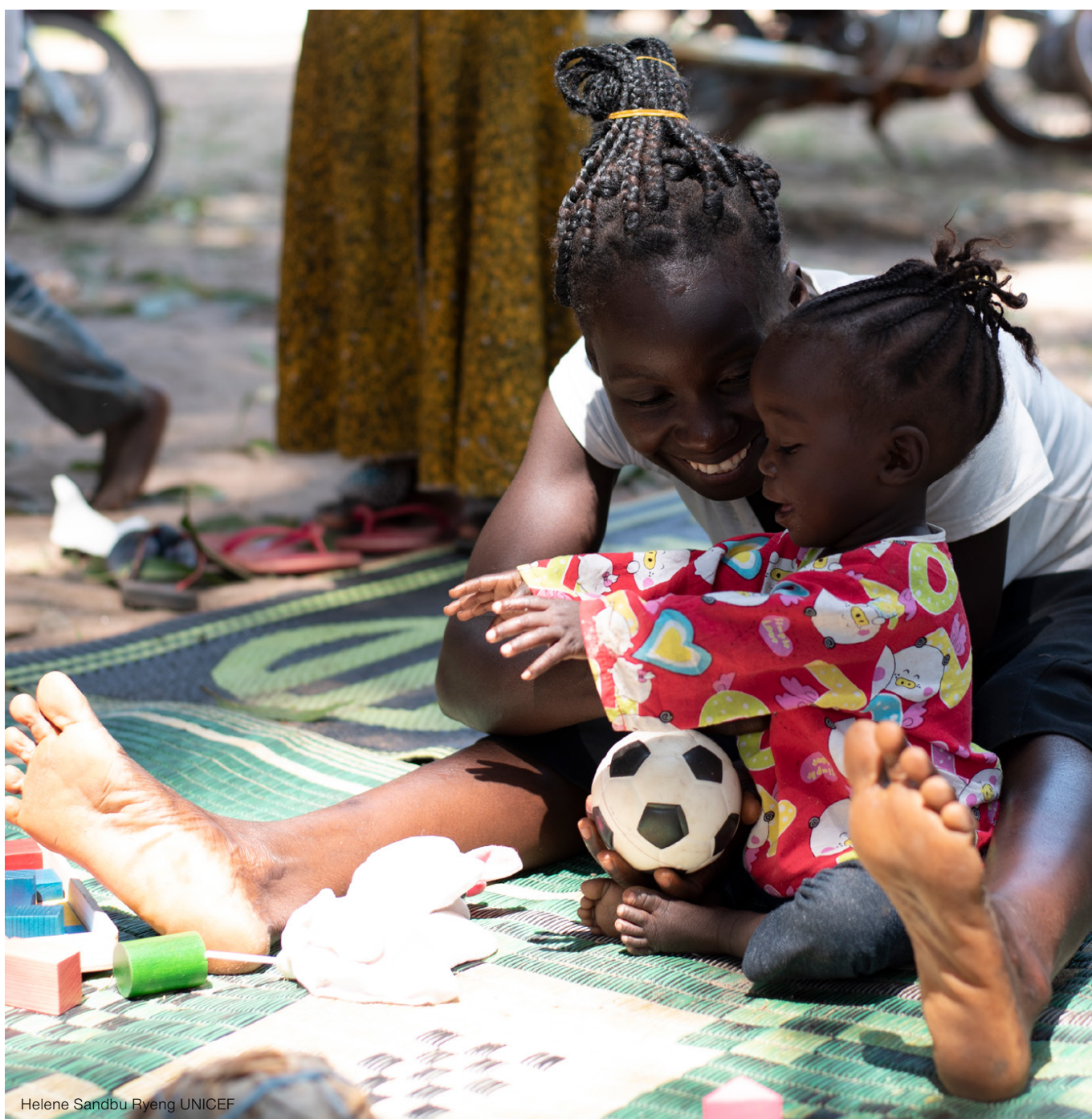
Helene Sandbu Ryeng UNICEF

En Bosnia y Herzegovina, el proyecto HHC compuso un equipo multidisciplinario que identificó factores de riesgo que causaban la institucionalización de niños y niñas en el país y formuló criterios basados en esos factores de riesgo. Los criterios incluían familias que sufrían de pobreza; desempleo; familias con tres o más niños, niñas; una situación inestable en el hogar; condiciones preexistentes de salud o discapacidad de un miembro de la familia; historia de abandono o abuso en el hogar; y familias con niños o niñas que ya han sido colocados en una institución. El equipo halló que la separación de familias se motiva por múltiples factores de riesgo que se van acumulando. HHC notó que los niños y niñas a los que asistían habían pasado por experiencias de cinco a seis factores de riesgo. Se compartió este criterio con los centros municipales para el servicio social, las escuelas, centros de atención médica y otras organizaciones gubernamentales y no gubernamentales y se empleó para remitir casos al proyecto HHC. Entonces, el personal HHC facilitaba una evaluación completa de los niños, niñas y sus familias. Las actividades de prevención consistían en ofrecer asistencia a los hogares en riesgo de separación y establecer centros comunitarios para aumentar el acceso a los servicios sociales y reducir la vulnerabilidad en los hogares.