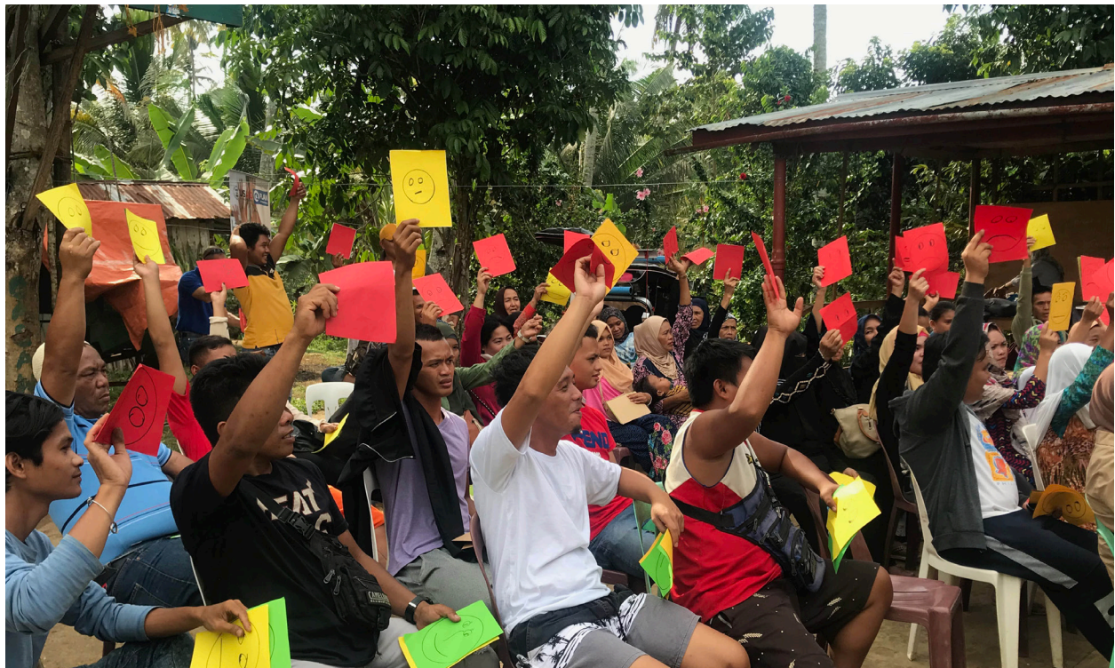
Plan International (2020).

Vous trouverez ci-dessous un modèle de carte de pointage. Contextualisez-le pour respecter les échéances convenues ou pour ajouter d'autres normes que les communautés souhaitent appliquer. Adapté de la Boîte à outils sur la qualité, l'impact et la redevabilité du programme de Plan International.