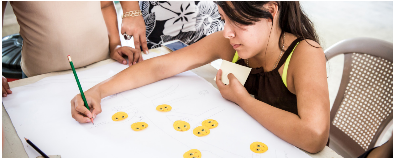
Plan International (2020).

L'état des lieux (parfois appelé mappage) est une activité très participative qui se fait en petits groupes qui élaborent conjointement une représentation visuelle de l'état des lieux de leur communauté. On peut dessiner sur de grandes feuilles de papier avec des marqueurs, ainsi que sur le sol à l'aide de matériaux locaux (par exemple, bâtons, pierres, autres objets pour représenter les structures).