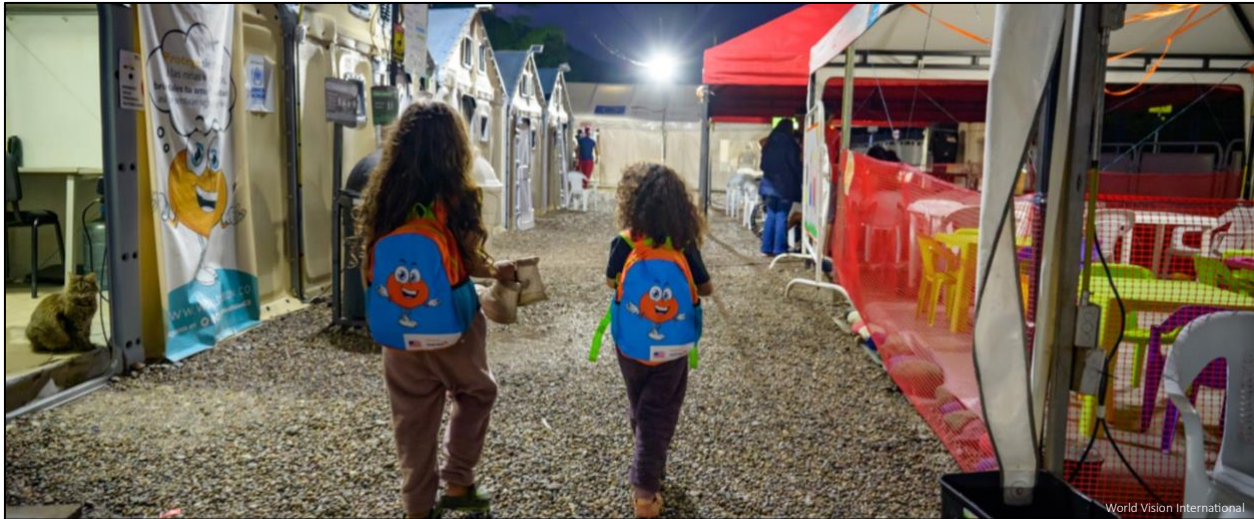
4: Dos niños alojados en el refugio CAS Hermanos Caminantes en marzo de 2023 se dirigen a una tienda de campaña para cenar. CAS Hermanos Caminantes es un refugio gestionado por World Vision que se encuentra en la carretera que une Cúcuta con Bucaramanga, Colombia.

11 600 menores cruzaron la ruta del Mediterráneo central hasta Italia sin sus progenitores o tutores legales entre enero y mediados de septiembre de 2023, lo que implica un aumento del 60 % con respecto al mismo periodo del año anterior. 10 En 2023 y en comparación con 2022, se multiplicó por siete el número de menores que cruzó el Tapón del Darién , una selva remota y peligrosa situada en la frontera entre Colombia y Panamá . Las cifras de menores no acompañados y separados también fue mayor. 11 Sin el amparo de sus familias o cuidadores, la niñez y la adolescencia corre un mayor riesgo de sufrir explotación, maltrato y abandono, reclutamiento por fuerzas y grupos armados, migración en condiciones peligrosas, trabajo infantil, violencia de género y ausencia de escolarización durante periodos prolongados, además de una alta probabilidad de no volver a la escuela.