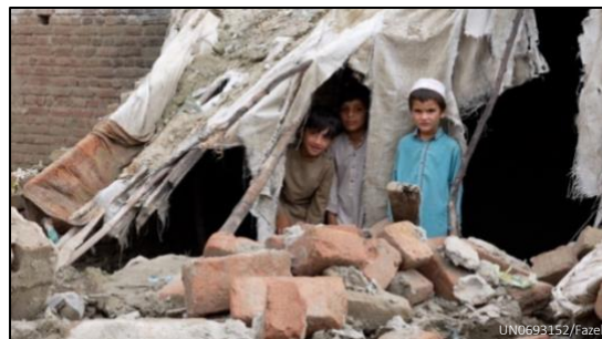
2: El 22 de agosto de 2023, tres niños se acurrucaban bajo los escombros de su casa en Jalalabad, destruida por las recientes inundaciones en la provincia de Nangarhar, al este de Afganistán.

Los devastadores terremotos de Siria, Afganistán, Türkiye y Marruecos han sacudido con violencia las vidas de los menores y sus familias. A los mecanismos de protección social, ya saturados por la pandemia mundial y por otras crisis, cada vez les cuesta más colmar las crecientes necesidades de los menores más vulnerables y de sus familias.