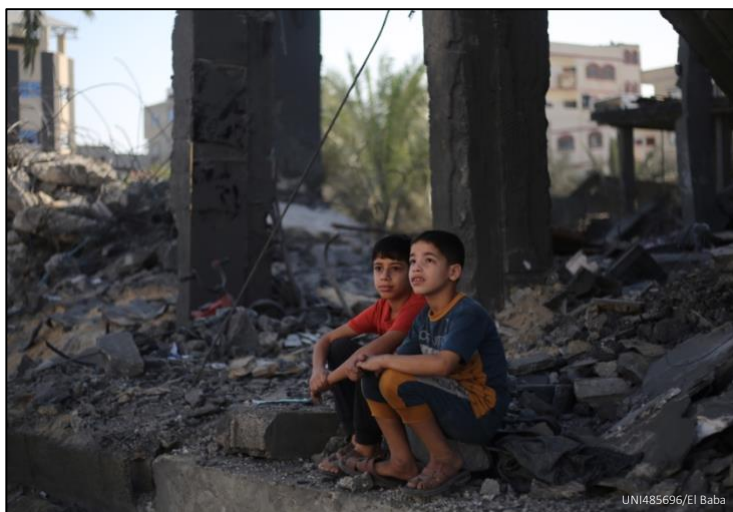
1: Dos niños palestinos sentados entre los escombros de lo que queda de su casa en la ciudad de Rafah, al sur de la Franja de Gaza, en noviembre de 2023.

El Informe de 2023 del Secretario General de las Naciones Unidas sobre los niños y los conflictos armados 4 reveló las mayores cifras registradas hasta la fecha de violaciones graves verificadas contra la niñez de 2022. La mayor parte de ellas ocurrieron en República Democrática del Congo, Israel y el Estado de Palestina, Somalia, Ucrania y Siria . Los ataques a centros educativos y hospitales aumentaron en un 112 % y el reclutamiento y la utilización de los menores por fuerzas y grupos armados creció un 21 % en comparación con el año anterior. Debido al estallido o a la escalada de diversos conflictos durante 2023, sobre